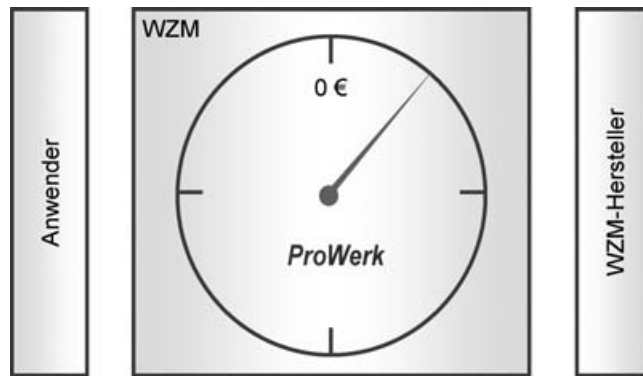
Bild 3. Neutraler TCO-Fahrtenschreiber zwischen WZM-Hersteller und -Nutzer

ren TCO bereitstellt (Bild 3). Hiermit wird die Wirtschaftlichkeitswirkung aller IH-Maßnahmen beobachtet. Auf diese Informationen wird vom IPS-System zurückgegriffen. Der Trend der TCO-Daten lässt sich als zusätzliches Kriterium in die IH-Planung integrieren. Neben dem Produktionsbereich wird sich die Planungsabteilung des Partners Volkswagen an diesen Arbeiten intensiv beteiligen.